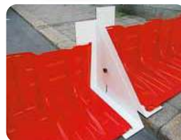
▲段差対応アタッチメント