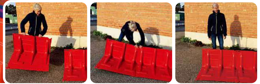
▲設置は、ボックスウォールを背後から見て左から右に並べる

Boxwallは特殊な工具やスキルを必要とせず設置ができ、ユニットのジョイント部(▼印)をつなぐことができます。各ジョイント部は±3度の調節ができ、カーブした設置場所でも対応可能です。