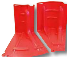
▲アウトコーナー(左)インコーナー(右)